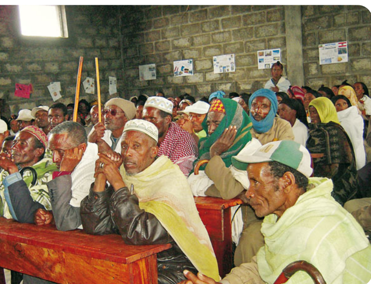
Unterstützung für ein Schulprojekt im Hochland von Äthiopien

Röhsner: Da gibt es eine Vielzahl von kleineren Aktivitäten, wie die Beteiligung an Benefizveranstaltungen, wie Charity-Läufen, Fußballturnieren mitsamt Spendenleistung für einen bestimmten Zweck. Die Initiativen dafür kommen zumeist von MitarbeiterInnen, die selbst bei Projekten mitarbeiten oder diese initiieren. Darüber hinaus möchte ich noch zwei Projekte hervorheben. Die Beteiligung an der Mirno More Friedensflotte mit benachteiligten Kindern und Jugendlichen aus ganz Europa. Unter der Flagge der Unternehmensgruppe die Berater ®, CATRO Personalberatung und MAKAM Market Research sind wir mit einem eigenen Schiff mit vier Kindern und zwei BetreuerInnen mit dabei. Die Kinder haben die Möglichkeit, andere Kulturen kennenzulernen, ihre sozialen Kompetenzen, die Teamfähigkeit und das Verantwortungsbewusstsein zu stärken. Ein weiteres Projekt, dass ich erwähnen möchte, ist die Unterstützung der Bubenburg in Fügen in Tirol. In dieser Einrichtung werden sozial benachteiligte Burschen betreut. Wir bereiten sie mit Coachings und Bewerbungsschulungen auf den Schritt ins Arbeitsleben vor.